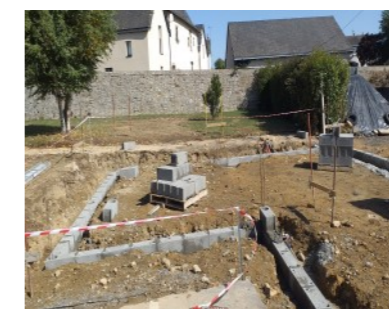
Début des travaux à la salle de la Mé- tairie suite à l'incendie Elle a été détruite entièrement Fin des travaux prévus en mars 2020