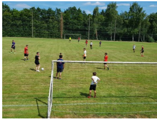
Tournoi inter familles de l'AS