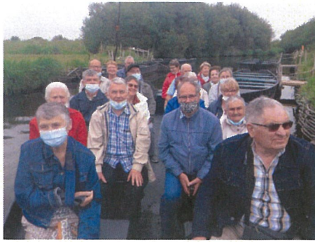
Génération Mouvement : Sortie aux marais salants de Guérande et au parc naturel de Brière avec les membres de l'association.