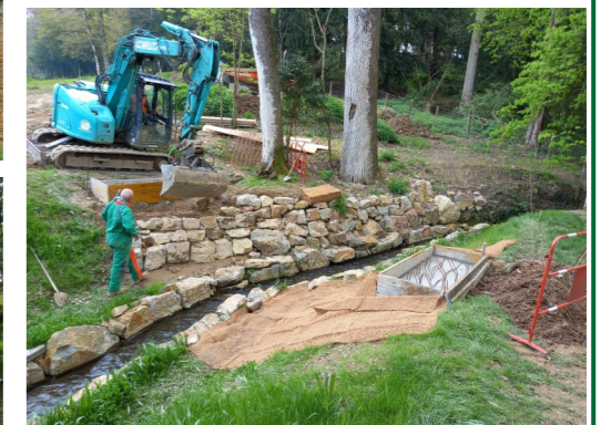
Le parc des Hunaudières : empiérement du chemin d'accès, construction d'un abri pour les animaux et pose d'une passerelle pour le passage du ruisseau