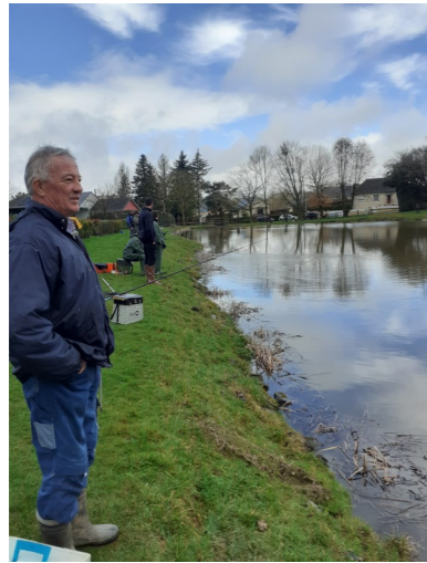
Pêche à la truite organisée par le comité des fêtes à l'Etang communal