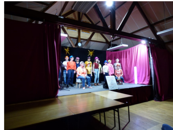
Spectacle Chant Théâtre 2023 proposé par l'Association Saturn'Anim avec la troupe du train chantant et la troupe du Pommier, les 31 mars, 1er et 2 avril 2023