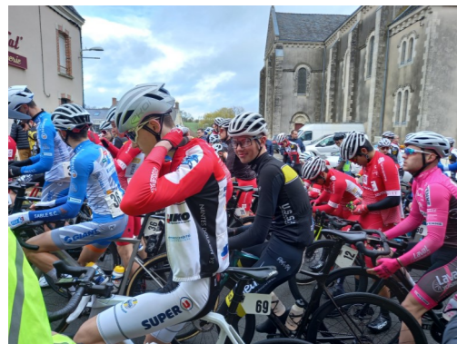
Course cycliste du Pays de Craon le 26 mars 2023