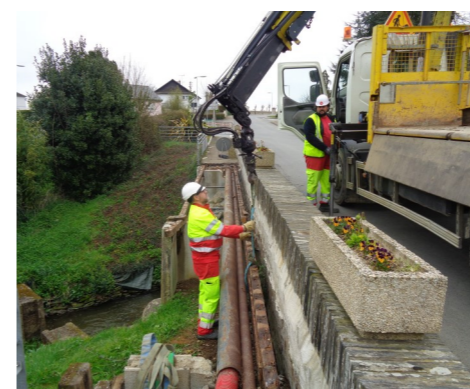
Travaux de réfection de la passerelle, rue principale Travaux route de la Crue 1ère phase : réfection des réseaux eaux pluviales et assainissement