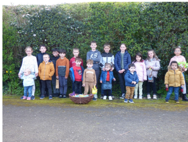
Chasse aux œufs avec l'Association Saturn'Anim le 8 avril 2023