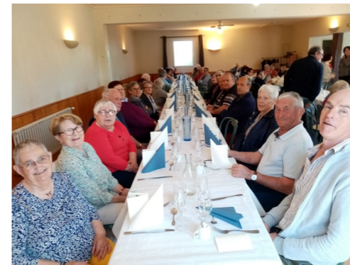
Le repas des Aînés